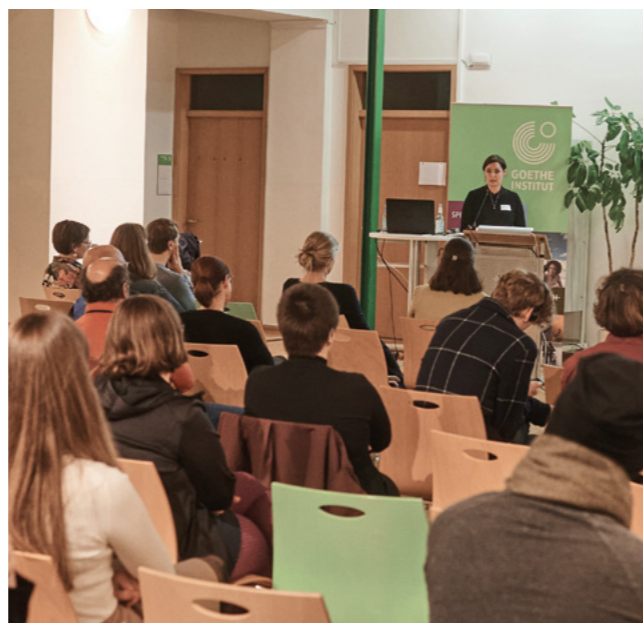
Abb.: Lesung mit Katharina Nocun „True Facts – Was gegen Verschwörungserzählungen wirklich hilft“ im Goethe-Institut Dresden // Copyright: Stephan Floss

der Einfluss antidemokratischer Haltungen. Wir waren im Herbst 2022 Mitveranstalter*in einer trinationalen Konferenz des Zentrums für internationale Kulturelle Bildung am Goethe-Institut Dresden . Geboten waren Vorträge, Workshops, Vernetzungsmöglichkeiten und Diskussionen. Mit Journalist*innen, Wissenschaftler*innen, Expert*innen, Aktivist*innen und Interessierten aus den drei Ländern wurden an zwei aufeinanderfolgenden Tagen unterschiedliche Fragen diskutiert: Was können die Länder voneinander lernen, wenn es um die zivilgesellschaftliche Unterstützung von Geflüchteten geht? Und wie können sich demokratische Akteur*innen vernetzen und grenzüberschreitend besser zusammenarbeiten?