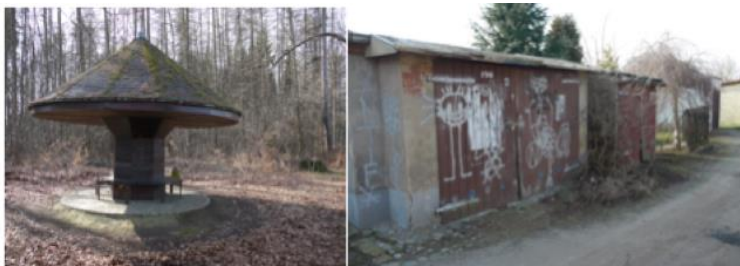
Selbstgewählte Treffpunkte Jugendlicher in den letzten Jahren: Im Wäldchen (links) und einer alten Garage (rechts)

Vielmehr erzählten sie uns bei einem Streifzug mit Fotokamera durch die Stadt, wie sie sich, als sie noch jünger waren, an einem überdachten Ort im Harthaer Wäldchen getroffen haben, um gemeinsam und „ungestört von Erwachsenen“ Freizeit zu verbringen. Später verbrachten sie viel Freizeit in einer alten Garage in der Nähe des Marktes, die ihnen zur Nutzung überlassen wurde. Dort renovierten sie ein wenig und bauten einen Ofen ein – wieder mit dem Ziel sich unabhängig von der Erwachsenenwelt zu treffen, zu reden oder zu feiern. Das Gelände der Garage wurde später verkauft – und war damit nicht mehr nutzbar. Heute sind einige der Jugendlichen aus der Garage Teil der Gruppe, die sich um den alten Bahnhof in Hartha und später das Gelände um die BRONX als selbstverwaltete Jugend- und Kulturzentren bemühen.